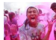
Colorida maratón en Taiwán

Un pato gigante pide que el mundo "continúe jugando"