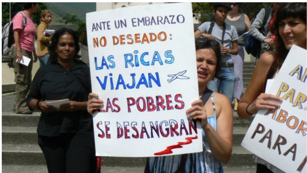
Aborto no punible, manifestación, imagen ilustrativa.

por MDZ Radio 6 de Abril de 2013 | 14:01