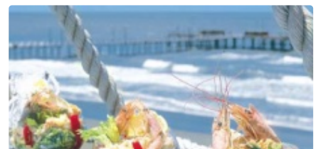
Cóctel de camarones