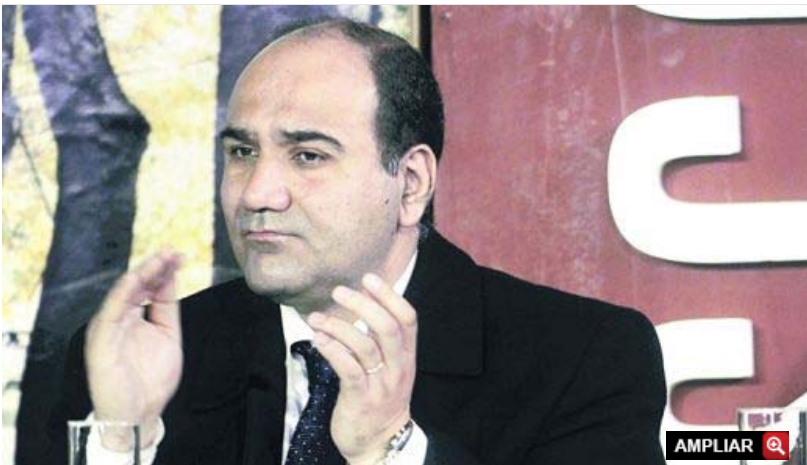
EN LA MIRA. EL MINISTRO MANZUR, AYER, EN UN ACTO OFICIAL EN CHASCOMUS.

El humor de la Presidenta no suele ser el mejor cuando algo se escapa de su control. Mucho peor cuando se trata de uno de sus ministros. Eso fue lo que supo en persona el titular de Salud, Juan Manzur -un católico practicante, el único funcionario que participó en el Tedéum del 9 de Julio en Tucumán- cuando recibió el llamado de Cristina Fernández de Kirchner para decirle que frenara de inmediato una guía que explica a los médicos en qué marco deben realizarse los abortos autorizados por la ley.